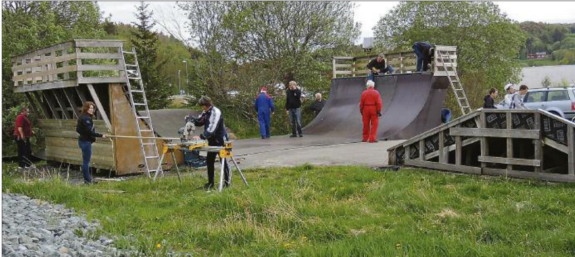
REPARASJONSARBEIDET er utført av Rotary-medlemmer over to mandagskvelder.

BJUGN: Skateboardbanen i Botngård er igjen en trygg lekeplass for ung-