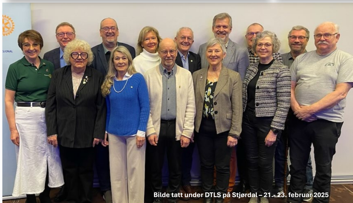
Bilde tatt under DTLS på Stjørdal – 21.-23. februar 2025