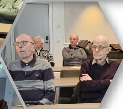
Medlemmer i Trondheim Internasjonale