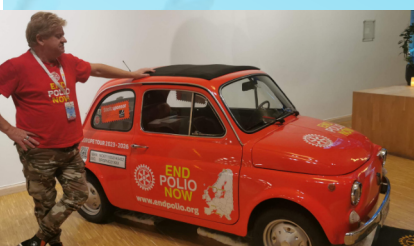
Under konferansen støttet deltakerne END POLIO med over 8000 kroner.

Sissel Slettum Bjerke og hennes stab hadde satt sammen et flott program. Mange interessante og gripende foredrag, - alle med den røde tematråden - HÅP