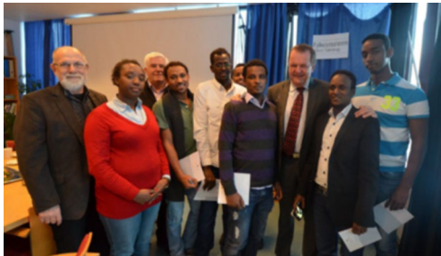
Levanger RK gir leksehjelp til innvandrere.