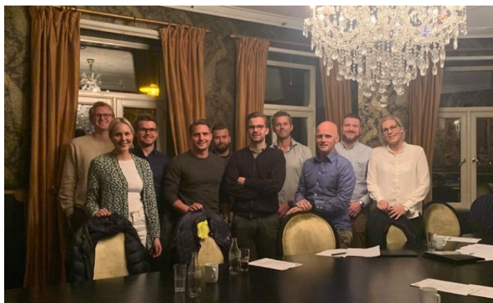
Stavern Ung Satellittklubb