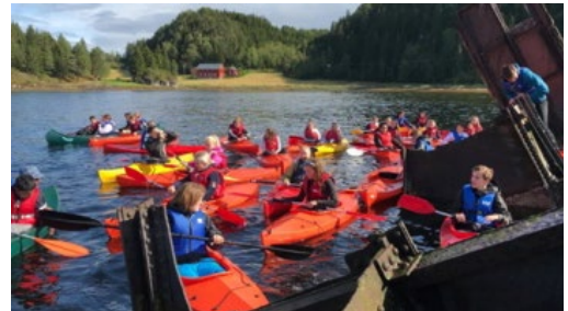
Levanger RK sørger for ferieopplevelser for alle.