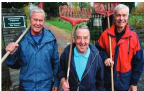
Klubben arrangerer tiltak som er til glede for lokalsamfunnet og trivelig for deltakerne.