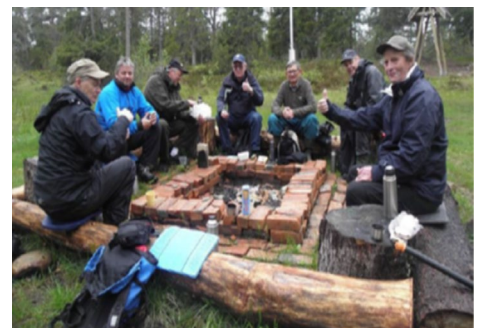
Heimdal RK foretar rydding langs Pilegrimsleden.