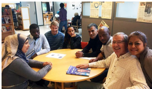
Heimdal RK deltar ved språkkafe.