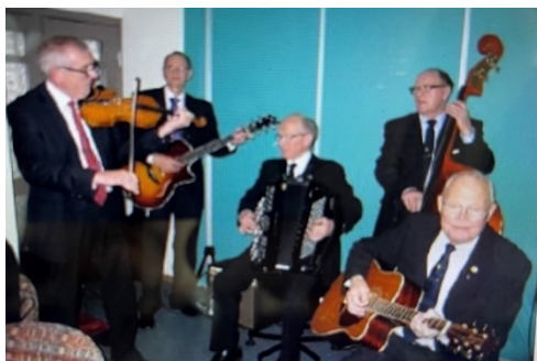
Klinga RK har sitt eget band: DDVa